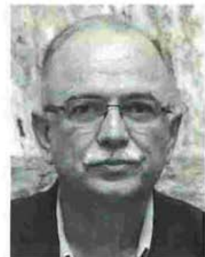
Ο Δημήτρης Παπαδημούλης θα μιλήσει το απόγευμα της Παρασκευής σε εκδήλωση στον Εμπορικό Σύλλογο