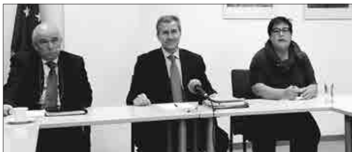
Από τη χθεσινή συνέντευξη Τύπου

(Με το Επιστημονικό Πάρκο, το Πανεπιστήμιο και με το υπό δημιουργία Ερευνητικό Κέντρο)