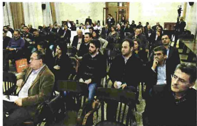
Η πρωτοβουλία ακούγεται οραματική, αλλά συνδυάζει την υψηλή φιλοδοξία με καλή οργάνωση και τεκνοκρατική συταγή