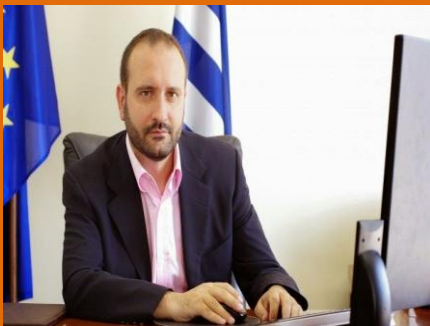
Κωνσταντίνος Κόλλιας Πρόεδρος του ΟΕΕ